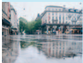
Ausstellungsort 1 Wohin der Regen geht (Zeughausplatz)

Die Wasserstadt besteht aus dem Wasserpfad mit 10 Orten (? Ausstellungsorte, 3 Satelliten). Die Lage der Orte ist aus dem Plan auf der Rückseite ersichtlich. Je nach Wunsch können alle oder auch nur einzelne Orte des Wasserpfads besucht werden, individuell oder geführt. Weitere Informationen zu den Themen der einzelnen Orte sind auf der Website www.wasserstadt.ch verfügbar. Sie verweist auch auf die aktuellen Veranstaltungen und Führungen in Zürich und Region.