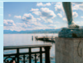
Ausstellungsort 3 Was für Wasser trinken wir? (Quaibrücke)