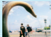
Ausstellungsort 2 Drum ist Wasser nicht gleich Wasser (Bürkliplatz)