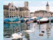
Ausstellungsort 4 Wasser, Fisch und Vogel («Riviera»)