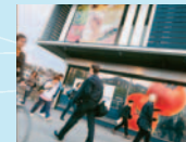
Ausstellungsort 7 Und überall ist Wasser drin (Bahnhofbrücke)