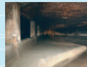
Ausstellungsort 5 Wasser im Untergrund (Münsterbrücke)