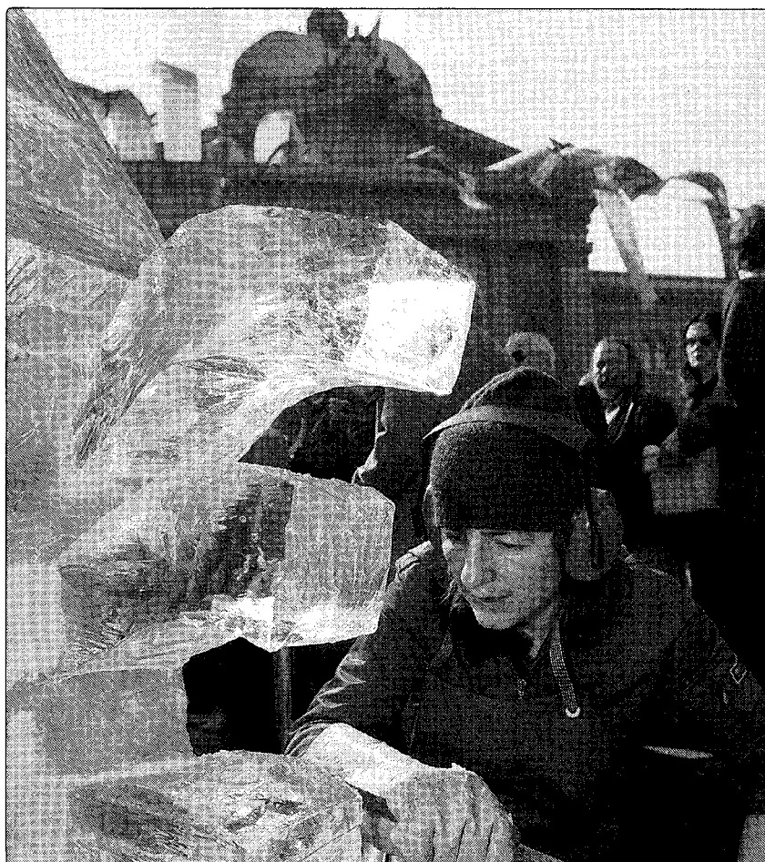
Eine Künstlerin arbeitet auf dem Bundesplatz an einer Eisskulptur.