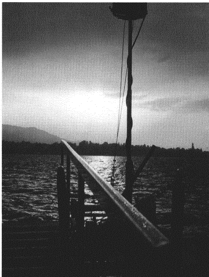
In der bald hundertjährigen Firmengeschichte der Kibag spielte das Element Wasser seit jeher eine wichtige Rolle. Die Transportflotte auf dem Zürichsee wird ergänzt durch das Partyschiff Ufnau, auf dem dieses Stimmungsbild von der abendlichen Rundfahrt aufgenommen worden ist.